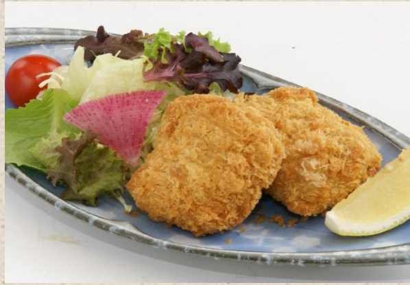
三元豚の厚切りヒレカツ・・・550円 セット・・・850円 (ご飯・漬物・味噌汁・小鉢付)