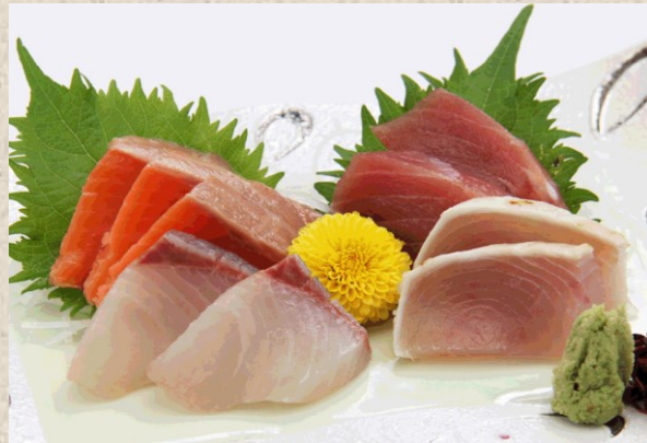
お造り盛り合わせ・・・880円 セット・・・960円 (ご飯・漬物・味噌汁・小鉢付)