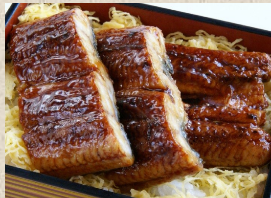
鰻重 (漬物、味噌汁付き)・・・1600円