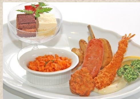
お子様ランチ・・・800円 (小学生以下限定メニュー)