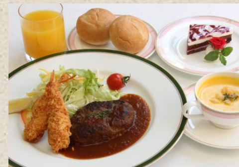
お子様スペシャル・・・1320円 (小学生以下限定メニュー)