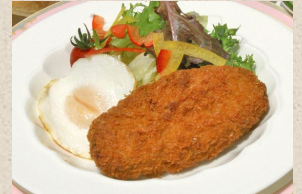
メンチカツと目玉焼き・・・700円 セット・・・850円 (スープ・パンorライス付)