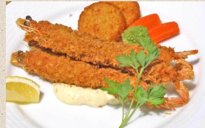
ジャンボ有頭海老フライ・・・1000円 セット・・・1150円 (スープ・サラダ・パンorライス付)