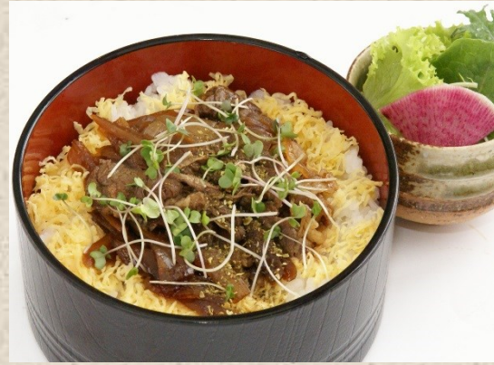
黒毛和牛の牛めし・・・650円 セット・・・950円 (漬物・味噌汁・小鉢付)