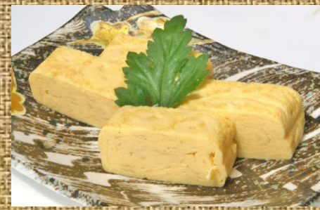
出し巻き玉子 500 円