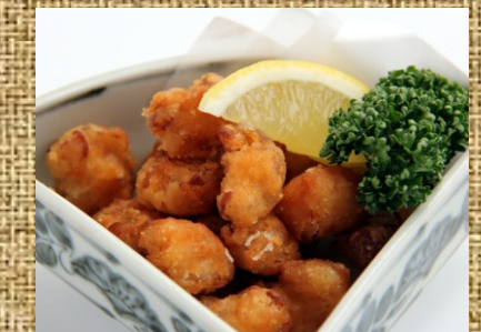
鶏なんこつ揚げ 300 円