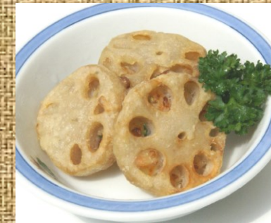
蓮根の挟み揚げ 300 円