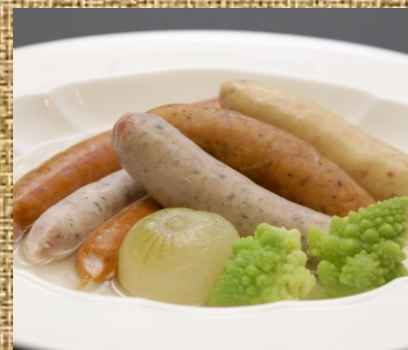
ピアソーセージ 980 円