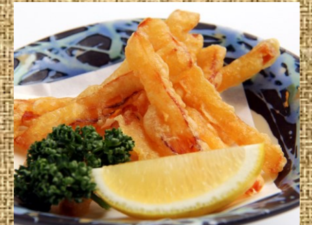
ずるめいかフライ 300 円