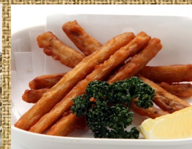
牛蒡の唐揚げ 300 円