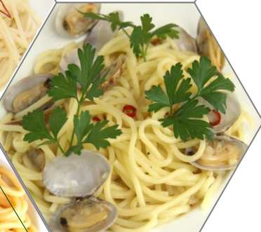
ボンゴレピアンコ 820 円