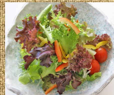
野菜サラダ 500 円