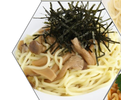
和風きのこ 820 円