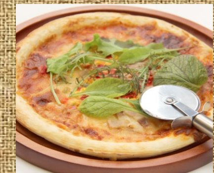
ミックスピザ 1,440 円