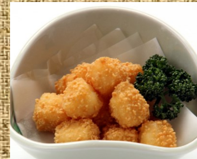
カリカリチーズ 500 円