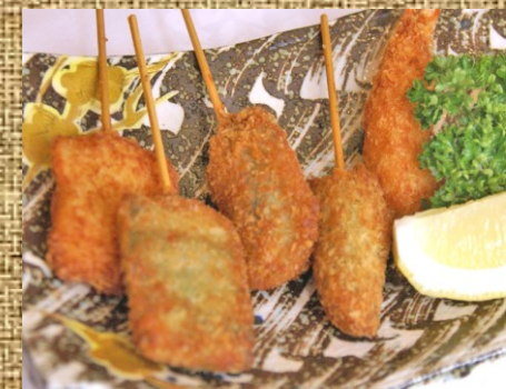
海鮮と野菜の串カツ 500 円