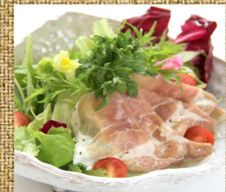
生ハムサラダ 720 円