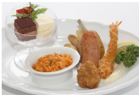
お子様ランチ 800 円

お子様ランチ・お子様ディナーのご注文は小学生以下のお子様に限らせていただきます。