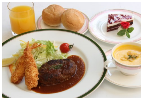
お子様ディナー 1,320 円

エビフライ 骨付きフランクフルト チキン唐揚げ フライドポテト チキンライス プチケーキ