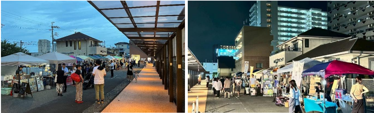
2025 年つがやまナイトマルシェの様子

本イベントでは、飲食・物販・ワークショップ等を通じて、地域の魅力発信と、子どもから大人まで楽しめる夏のイベントづくりを目指します。