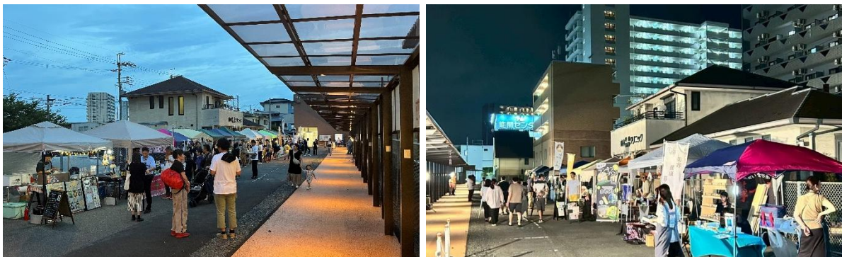
2025 年つがやまナイトマルシェの様子

本イベントでは、飲食・物販・ワークショップ等を通じて、地域の魅力発信と、子どもから大人まで楽しめる夏のイベントづくりを目指します。